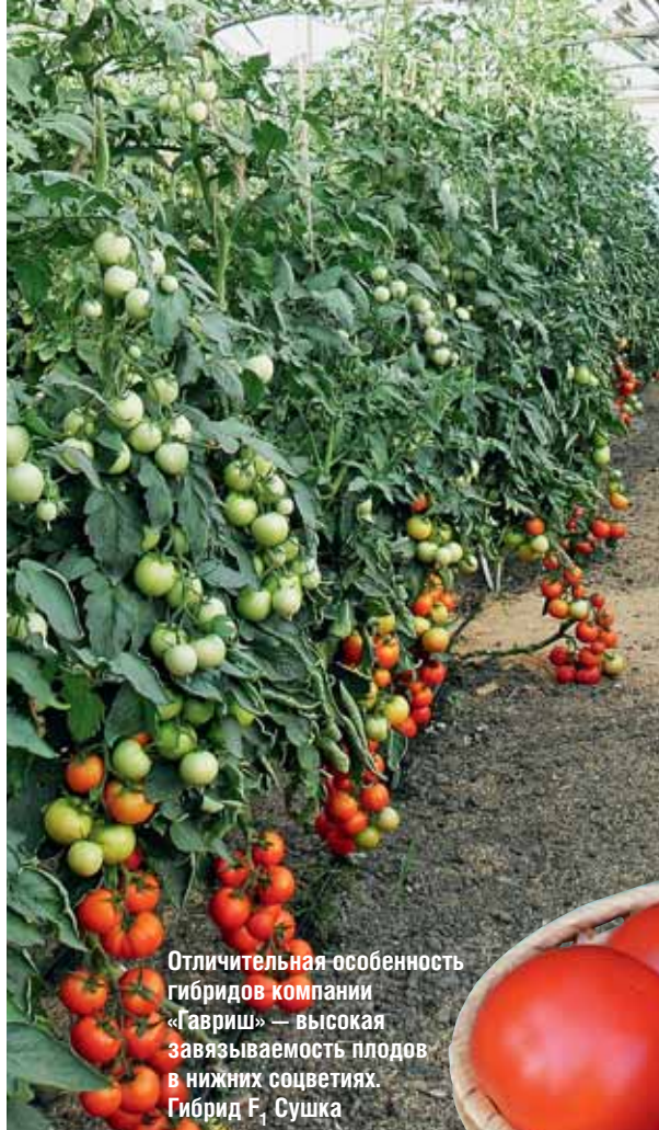
Отличительная особенность гибридов компании «Гавриш» — высокая завязываемость плодов в нижних соцветиях. Гибрид F 1 Сушка