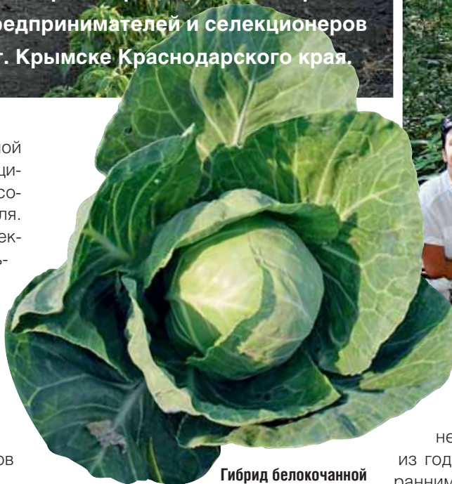
Гибрид белокачанной капусты F 1 Нахаленок

Овощеводство в Краснодарском крае относится к одному из приоритетных направлений АПК. В прошлом году кубанскими сельхозпроизводителями было собрано более 672 тыс. т овощей, что позволило краю занять третье место среди регионов России. Однако потенциал отрасли в крае этим далеко не исчерпан. К 2012 году планируется увеличить производство овощей до 930 тыс. т. Действует целевая программа развития сельского хозяйства и регулирования рын-