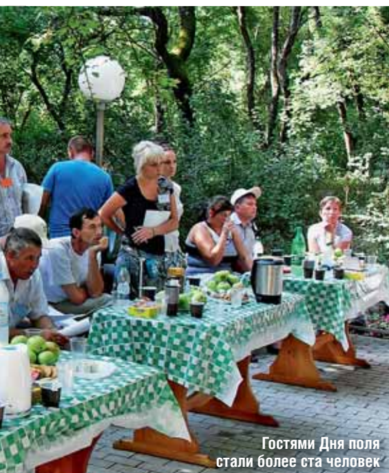
Гостями Дня поля стали более ста человек