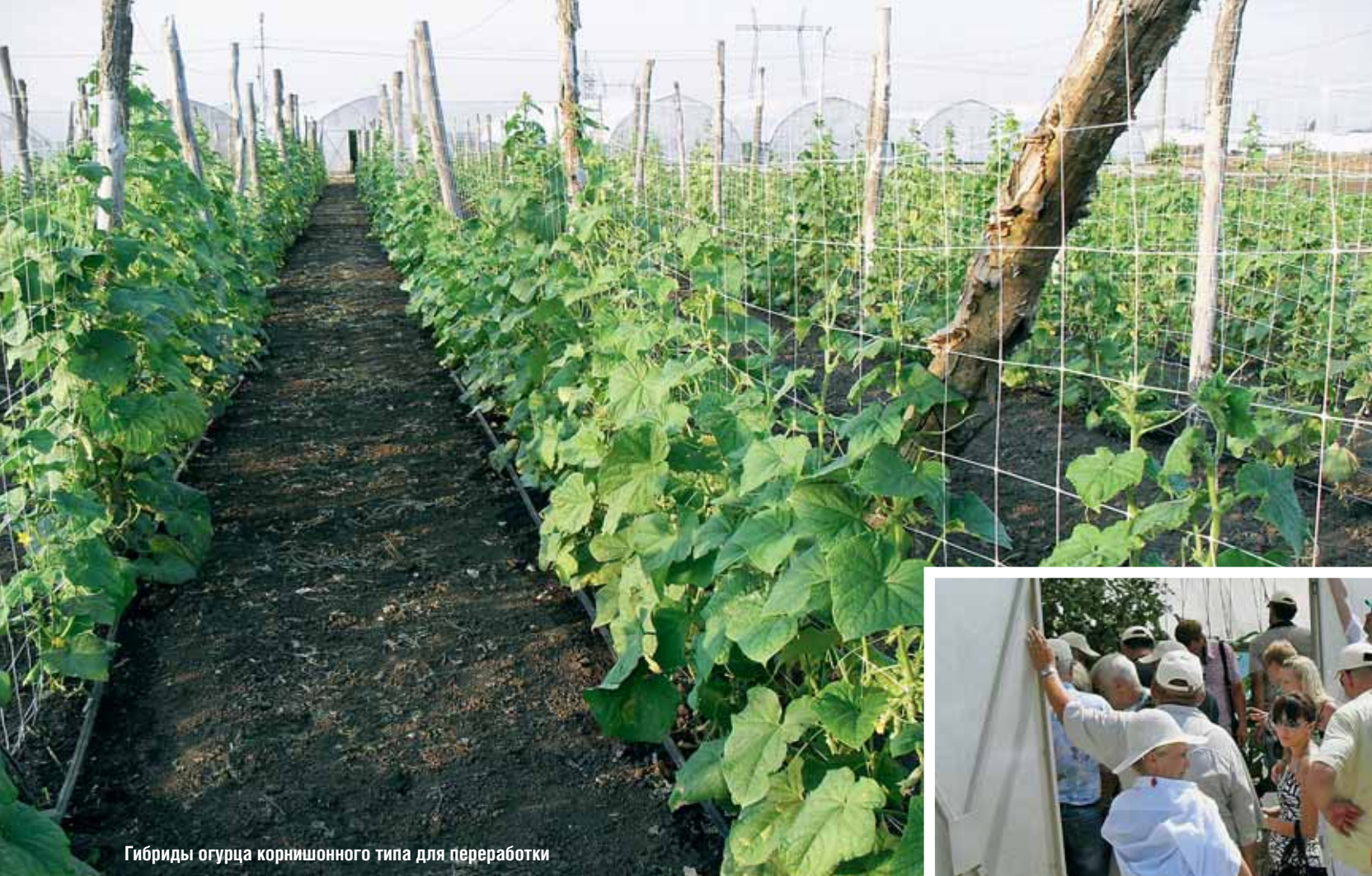
Гибриды огурца корнишонного типа для переработки