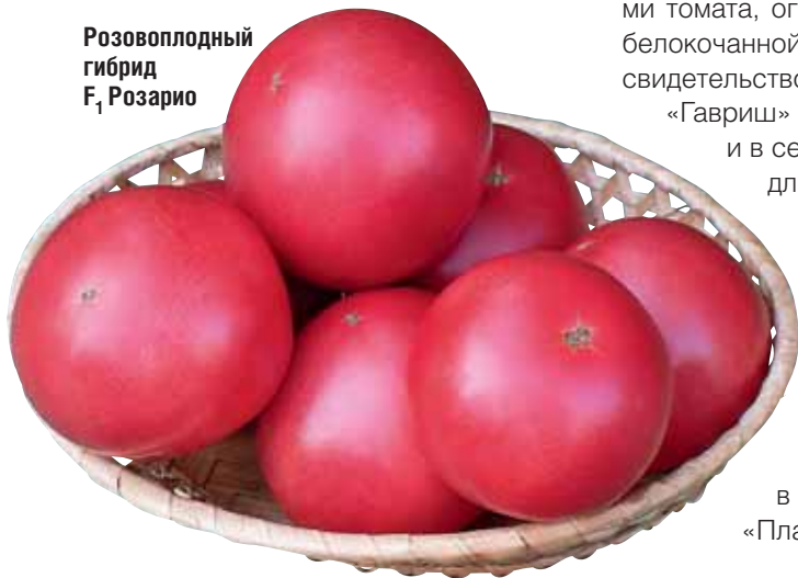
Розовоплодный гибрид F 1 Розарио

окраска плодов. В теплицах по соседству были представлены гибриды огурца — мощные растения с некрупными, ароматными, интенсивно окрашенными плодами. Никто не прошел мимо растений баклажана с блестящими плодами насыщенно фиолетовой окраски (гибрид F 1 Байкал).