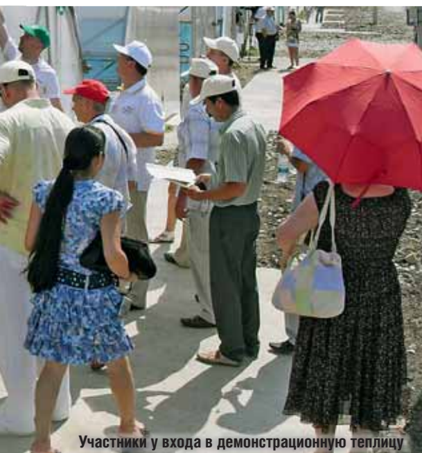
Участники у входа в демонстрационную теплицу

При выращивании крупноплодных гибридов томата на кисти обычно оставляют один плод. У гибрида F 1 Якиманка можно было видеть 4-5 плодов массой от 180 до 250 г в одном соцветии. Это стало возможным благодаря очень короткой оси соцветия, позволяющей избежать заломов. Вместе с тем необходимо помнить, что крупноплодные гибриды томата всегда менее скороспелы, поэтому гибриды нужно выбирать, исходя из цели выращивания.