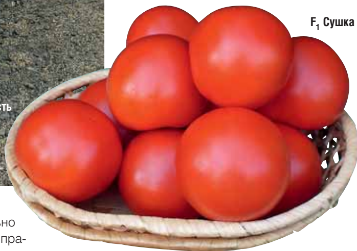
F 1 Сушка

ния плоды в довольно длинном соцветии практически одинакового размера, яркие и очень прочные.