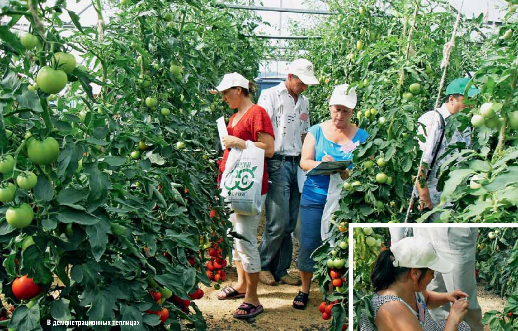
В демонстрационных теплицах

Гибриды томата в демонстрационных теплицах не оставили равнодушным никого — гости увидели растения с выравненными яркими плодами. Выбор был настолько широк, что каждый мог найти гибрид по своему вкусу. Кого-то привлекли крупные, яркие, выравненные, прочные плоды, а кого-то — высокая завязываемость как на нижних, так и на верхних соцветиях. Кому-то понравилась необычная форма, а кому-то — нежная розовая