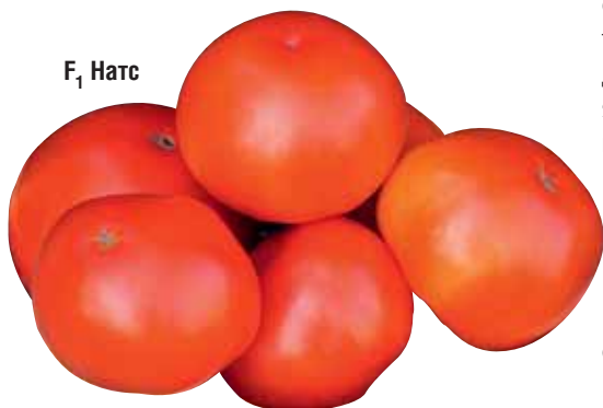
F 1 Натс

Компания предлагает гибриды томата для зимних и пленочных теплиц с плодами различного размера и самого разного назначения. Как отметил Сергей Федорович, в селекции томата на подходе совершенно новый материал, и фирма «Гавриш» продолжит радовать крупных производителей, фермеров, овощеводов-любителей новыми высокопродуктивными гибридами, отвечающими всем требованиям и капризам современного рынка.