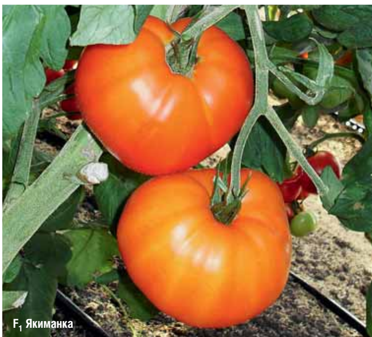
F 1 Якиманка