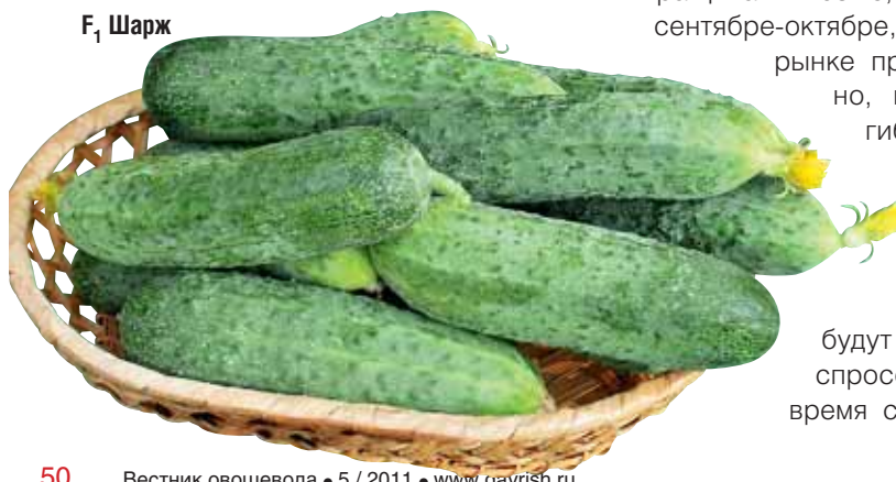
F 1 Шарж

лей становятся популярными зеленцы огурца с темной окраской. Этому требованию удовлетворяет гибрид F 1 Шарж с длиной плода 12-14 см и высоким потенциалом урожайности. Гибрид отличается интенсивным вегетативным ростом, что в условиях продолжительной вегетации играет важную роль. По урожайности среди короткоплодных гибридов огурца с бугорчатыми плодами непревзойденным остается гибрид F 1 Кураж . За первый месяц плодоношения в пленочных теплицах он дает от 14 до 18 кг/м 2 . Вместе с тем необходимо помнить, что избыточное минеральное питание растений и полив в молодом возрасте способны спровоцировать резкий вегетативный рост и