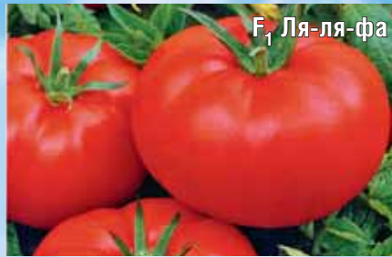
F 1 Ля-ля-фа

Гибрид среднего срока созревания. Растения мощные, невысокие. Плоды очень крупные — до 400 г, ярко-розовые, ровные, гладкие, преимущественно салатного назначения. Мякоть плодов нежная, сочная, вкусная, тающей консистенции. Плоды содержат в 2 раза больше витамина А, чем обычные томаты. Урожайность 8-11 кг/раст.