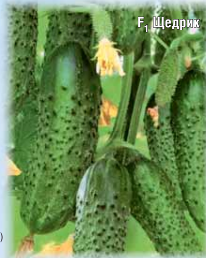
F 1 Щедрик

Среднеранний (115-130 дней от всходов до начала плодоношения), среднерослый (до 80 см) гибрид. Рекомендуется для выращивания в пленочных и остекленных теплицах. Плоды конусовидные, глянцево-красные, с насыщенным вкусом и нежным ароматом. Окраска в технической спелости зеленовато-белая, в биологической — красная. Масса плода 180 г, толщина стенки 7 мм. Мякоть нежная, сладкая, сочная. Вкус хороший. Урожайность до 6,1 кг/м 2 . Рекомендуется для использования в свежем виде, домашней кулинарии.