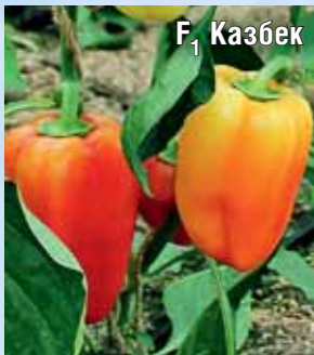
F 1 Казбек

Компактные штамбовые растения высотой до 100 см предназначены для выращивания в открытом грунте и пленочных теплицах. Толстостенные темно-красные конусовидные плоды обладают пряным ароматом и высокой прочностью. Масса плода до 140 г. Гибрид холодостойкий. Урожайность 6,8-7,6 кг/м 2 .