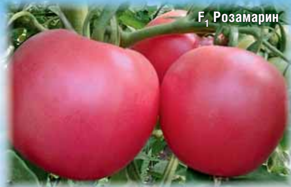
F 1 Розамарин

Гибрид среднего срока созревания. Растения мощные, невысокие. Плоды очень крупные — до 400 г, ярко-розовые, ровные, гладкие, преимущественно салатного назначения. Мякоть плодов нежная, сочная, вкусная, тающей консистенции. Плоды содержат в 2 раза больше витамина А, чем обычные томаты. Урожайность 8-11 кг/раст.